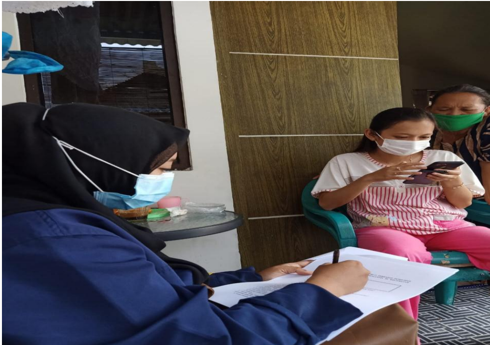
Lampiran 8. Foto -foto