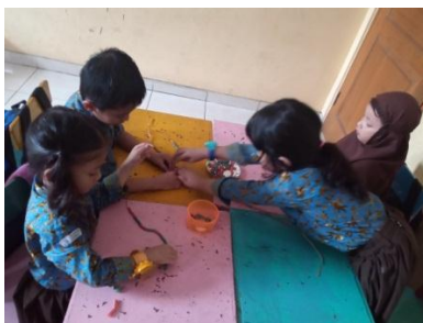
Membuat gelang, kalung dan cincin