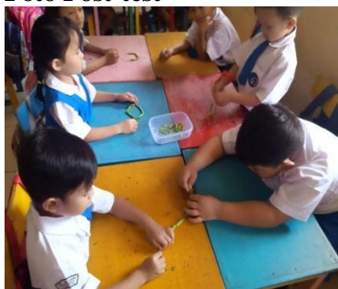
Meronce dari batang kankung