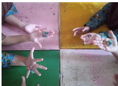
Hasil meronce dari sedotan plastic