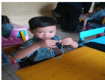
Kalung dari sedotan plastik