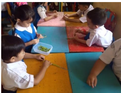
Membuat gelang, kalung dan cincin