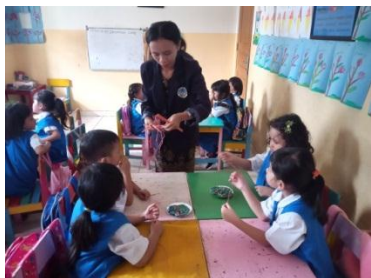
Meronce dari sedotan plastik