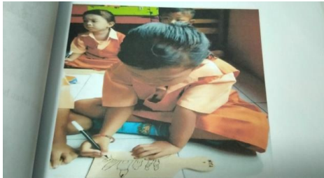
Anak mulai bisa melukis dengan berbagai media