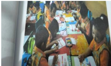
Anak mulai bisa melukis dengan berbagai media tanpa bantuan guru