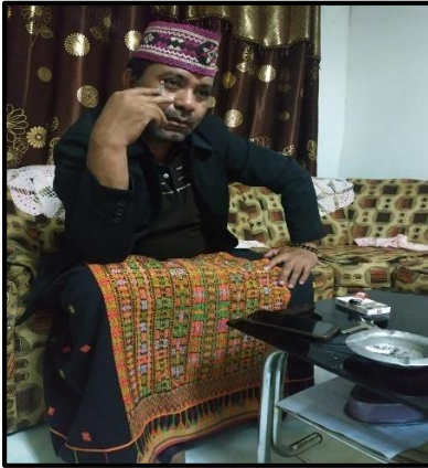
Tu'a adat Pau