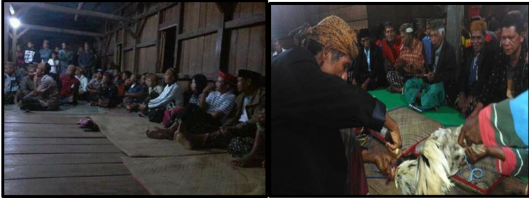
Pelaksanaan Upacara Adat Penti Dan Ritus Tudak