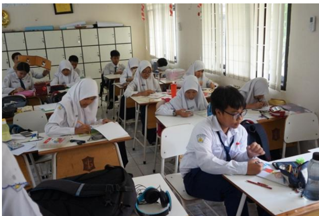
1.3 (Dokumentasi pribadi)