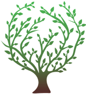
Gambar Ilustrasi Tanaman