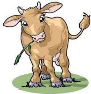
Gambar Ilustrasi Hewan