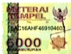
Luluk Meilana Putri

Surabaya, 08 Januari 2020 Yang membuat pernyataan,