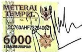
Ratih Puspita Hadi

Surabaya, 12 Februari 2020 Yang membuat pernyataan,