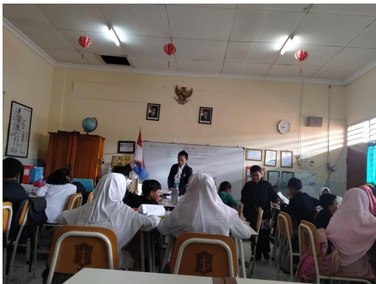
Foto foto pelaksanaan penelitian