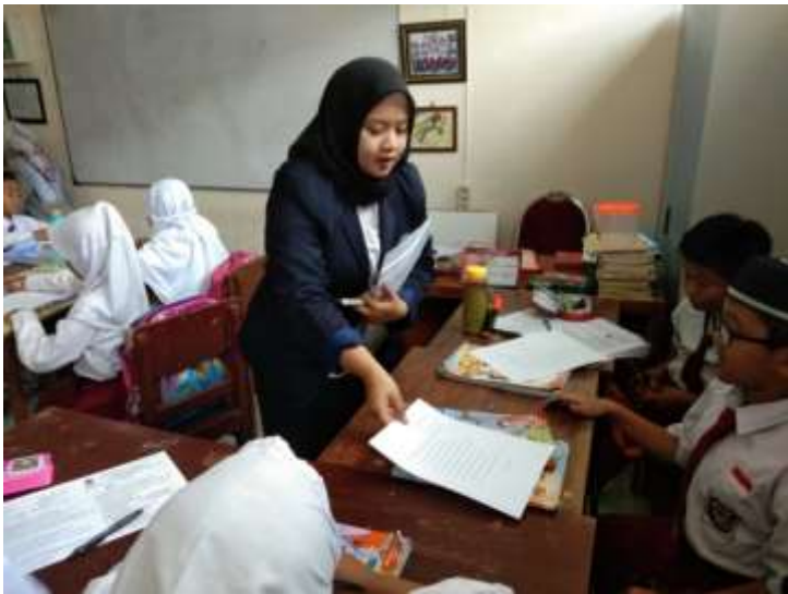
Kegiatan Menyampaikan Hasil Kerja Siswa Secara Berpasangan