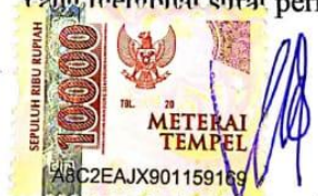
Evika dwi rahmawati