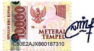
Novi Dela Anggraini

Surabaya, 27 Januari 2022 Yang membuat pernyataan,