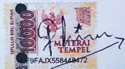
Dimas Nur Rohim

Surabaya, 12 Januari 2022 Yang membuat pernyataan,