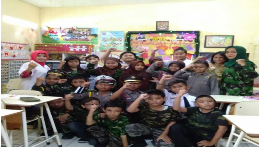
Foto Bersama Kelas IVB