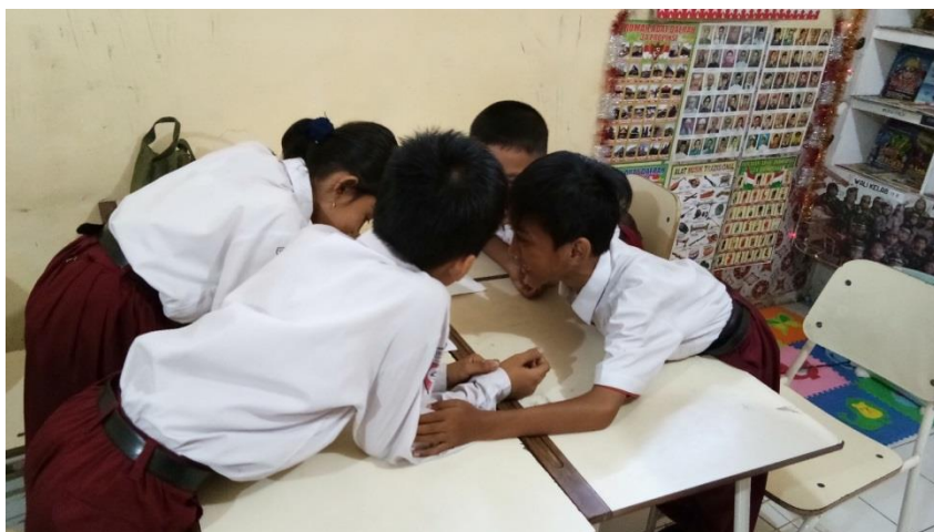
Berdiskusi Untuk Memecahkan Masalah Yang Diberikan Pendidik