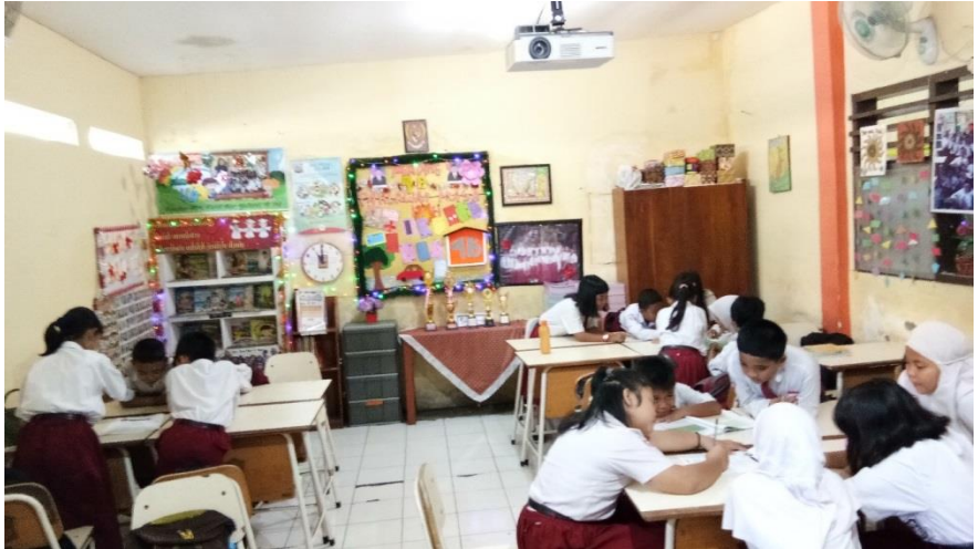
Suasana Pembelajaran Menggunakan Model Discovery Learning