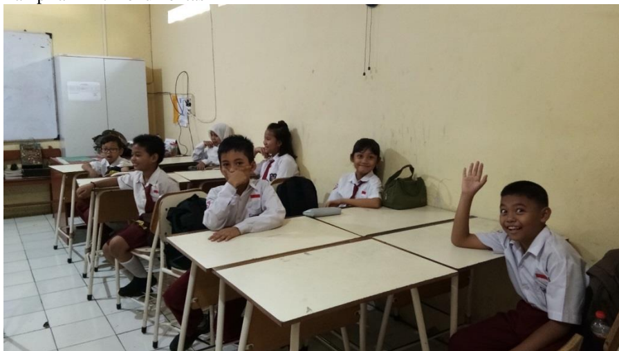
Kegiatan Pembelajaran Pemberian Rangsangan Berupa Pertanyaan Diawal Pembelajaran