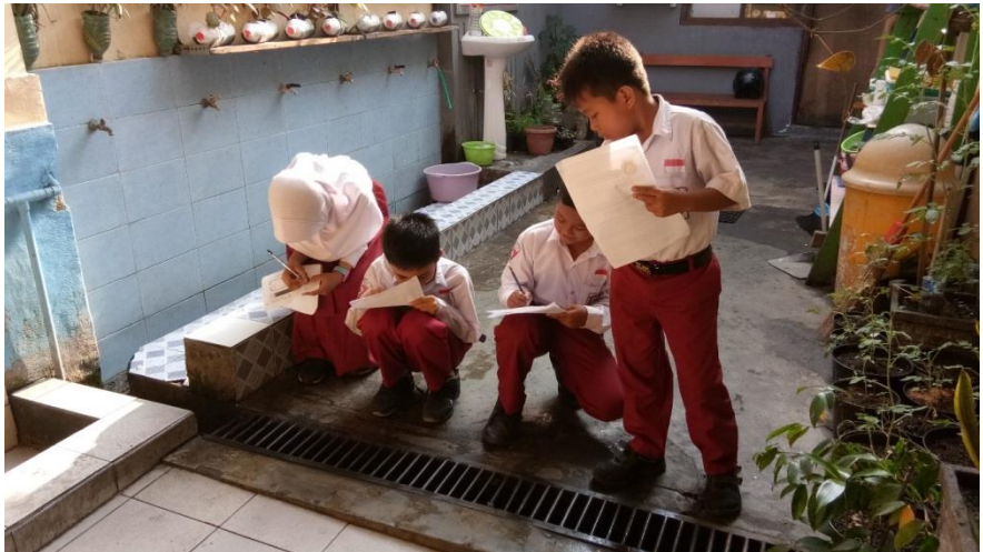
Proses Memecahkan Masalah Menggunakan Alternatif Lain