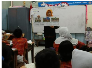
Guru menjelaskan media gambar