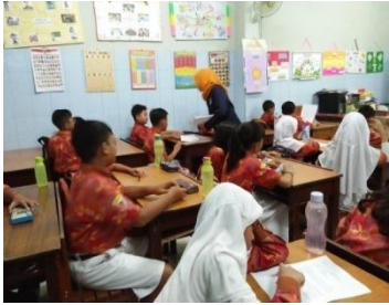
Guru membagikan soal Posttest