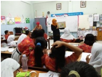
Guru menunjukkan media gambar