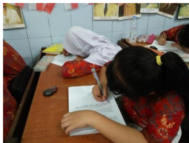
Siswa mengerjakan tes keterampilan menulis