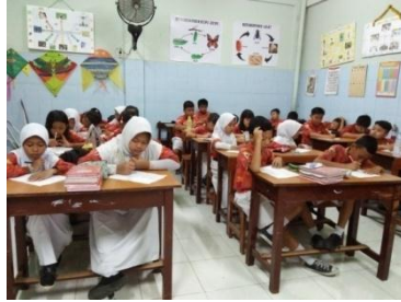
Siswa mengerjakan soal post-test