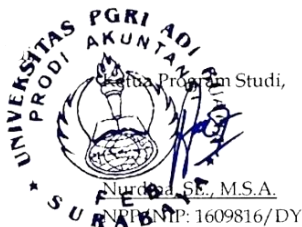
Nurdina S.E., M.S.A NPP. 1609816/DY

Surabaya, 04 Juli 2022 Dosem Pembimbing,