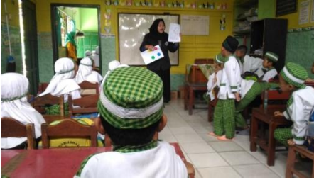
Foto Kegiatan Pre-Test