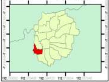
PETA LOKASI TAMAN ABHIRUPA KRIAN

Dipetakan oleh : Muhammad Tamannudja N. 153600807 Sistem Koordinat : UTM-WGS 1984 49S Map Locator