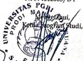
Imade Bagus Dwafita, S.E.M.M. NPP: 1109598/DY