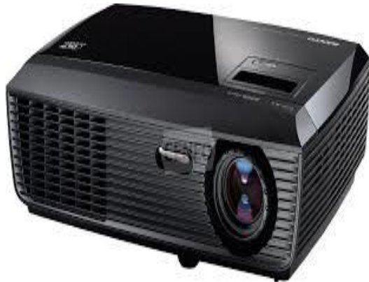
Gambar Alat Yang Dipergunakan Saat Pengambilan Data