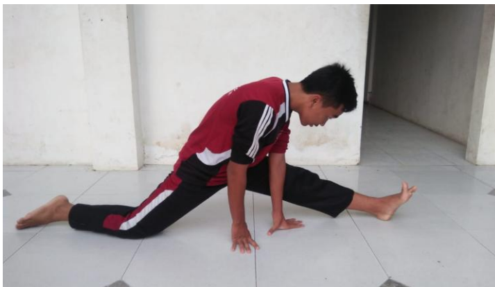
Gambar 3: Split Samping