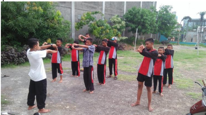
Gambar 1: Pemansan