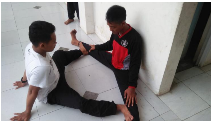
Gambar 2: Split Tengah