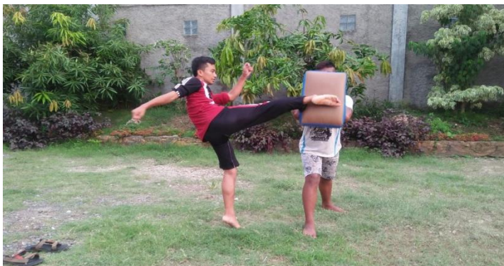
Gambar 5: Tendangan Sabit