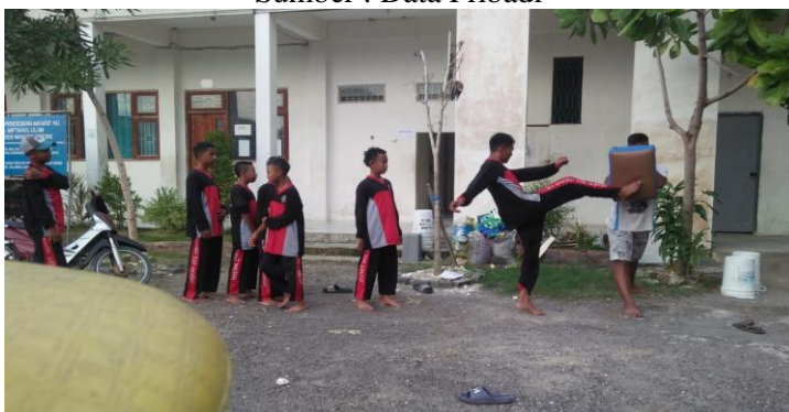
Gambar 6: Tendangan Sabit