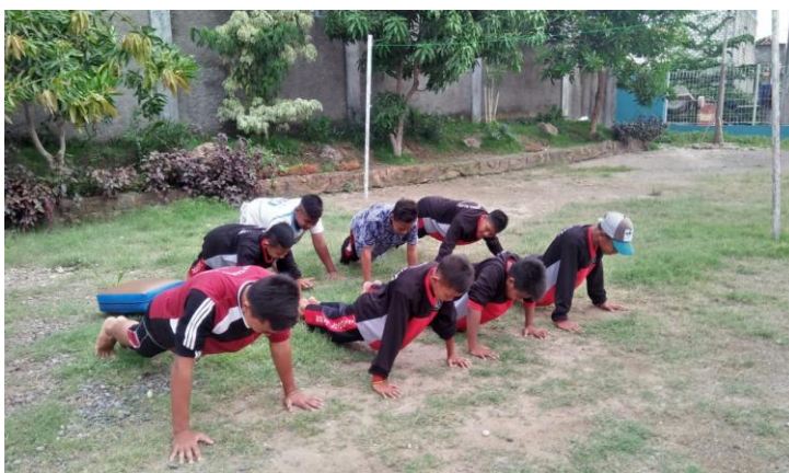
Gambar 4: Latihan Fisik