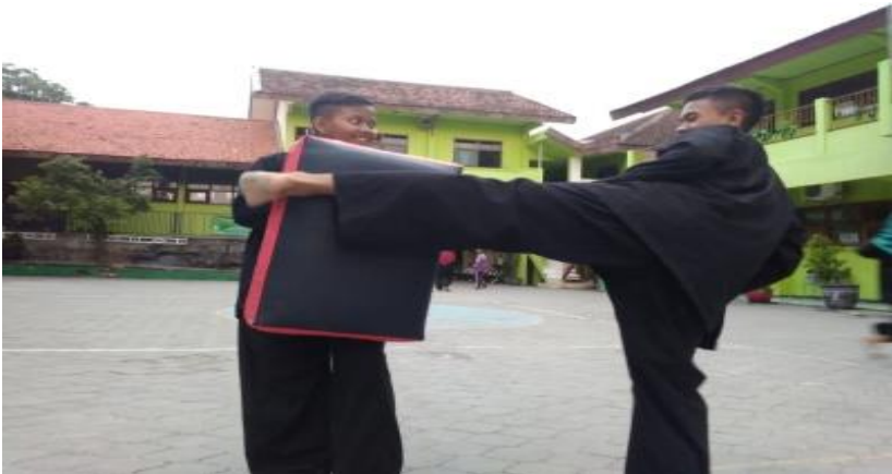
Gambar 4: Salah satu siswa juga sedang melakukan tendangan sabit saat berlangsungnya penelitian