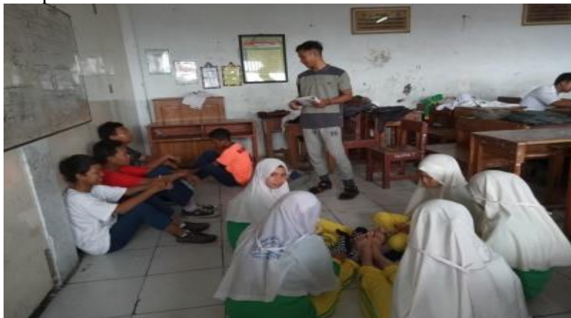
Gambar 1: Mendata siswa siswi yang akan dijadikan penelitian Dan memberikan arahan tentang program kegiatan penelitian