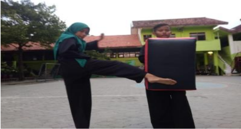
Gambar 3: Salah satu siswi SMPN 1 Bungah Gresik yang mengikuti penelitian yang dilakukan saat itu adalah melakukan tendangan sabit