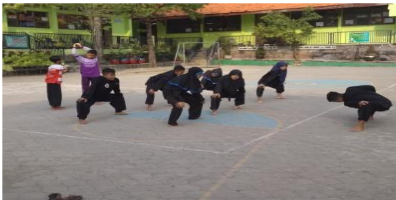
Gambar 2: Sebelum memulai penelitian dan latihan diawali pemanasan terlebih dahulu