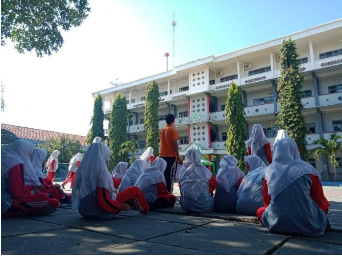
Gambar 3: Survei Permainan Bola Voli