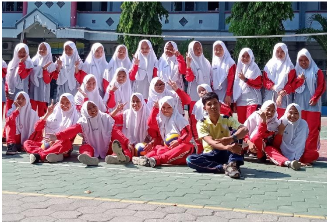
Gambar 1: Subjek Penelitian