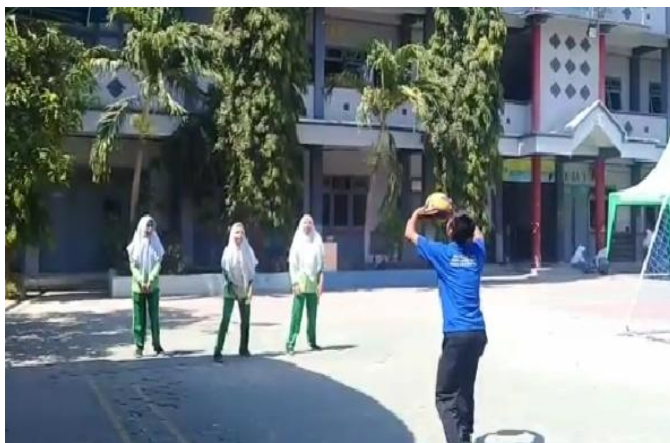
Gambar 2: Praktik Passing