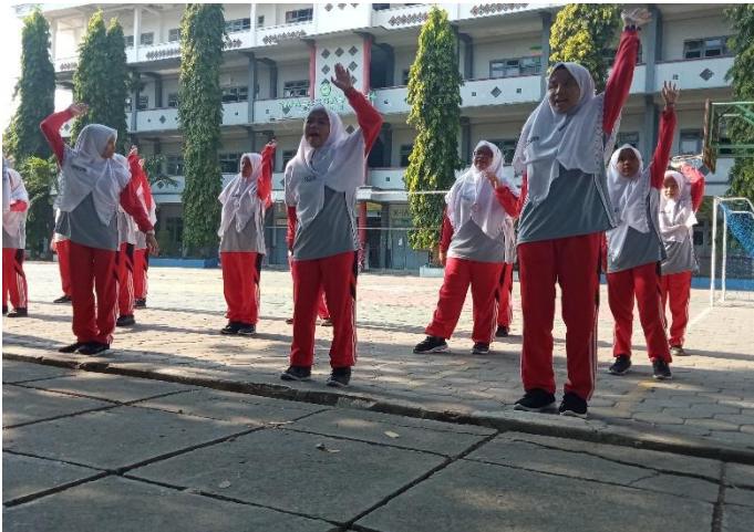
Gambar 4: Pemanasan