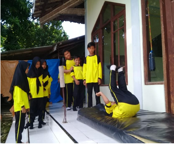
Gambar 7 Pelaksanaan posttes