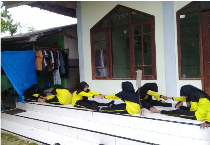
Gambar 6 Siswa melakukan permainan kelenturan