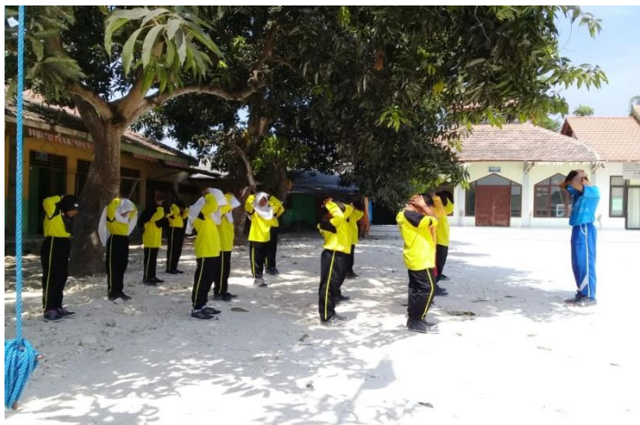
Gambar 2 Siswa melakukan pemanasan