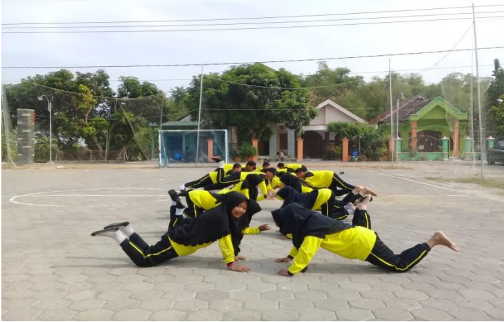
Gambar 5 Siswa melakukan permainan tepuk push up