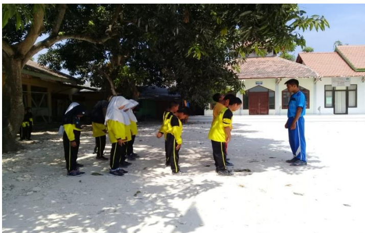
Gambar 1 Siswa melakukan do'a