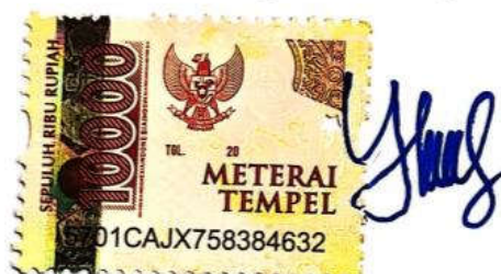
Eka Yulinda Salsabilah

Surabaya, 1 Februari 2022 Yang membuat pernyataan,