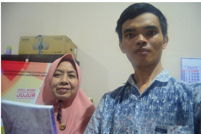
Bersama pegawai perpustakaan Balai Pelestarian Cagar Budaya Dokumentasi pribadi