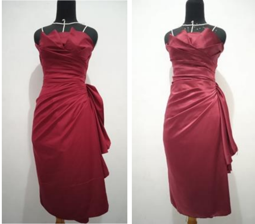
Gambar : Strapless dress menggunakan kain satin