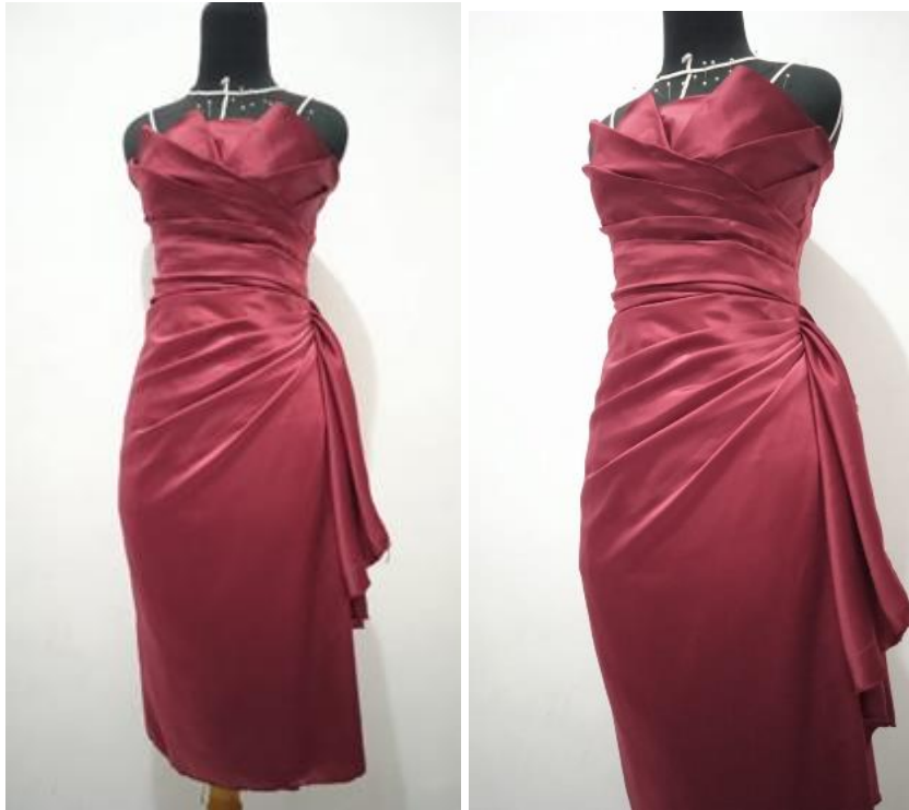
Gambar : Strapless dress menggunakan kain satin