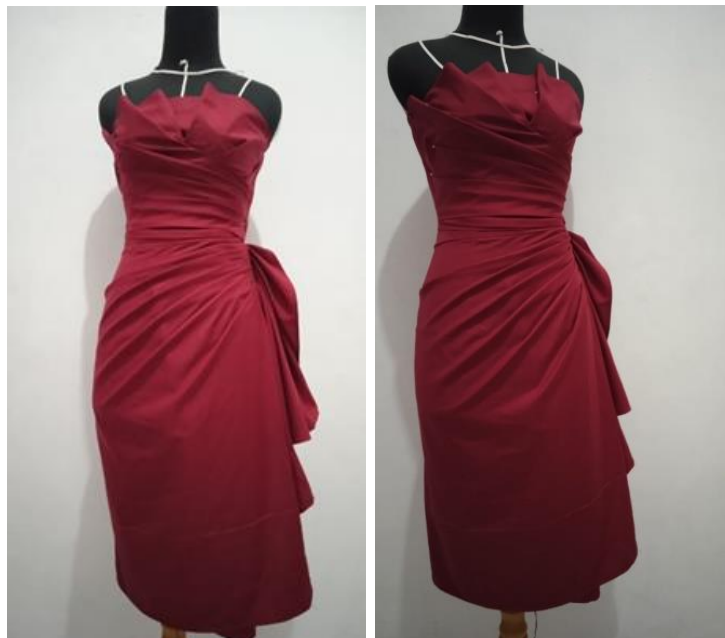
Gambar : Strapless Dress menggunakan kain katun