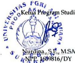
Nurdina, S.E., M.SA NPP. 1609816/DY