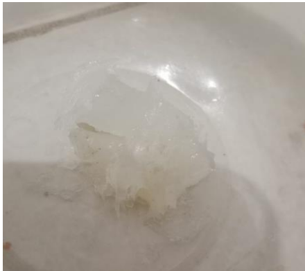
(Tanpa penambahan tepung pisang 0%)