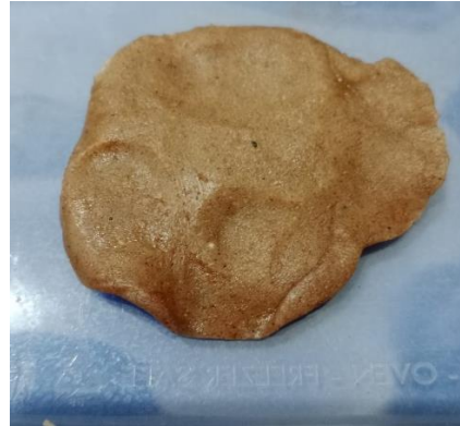
(Penambahan tepung pisang 10%)