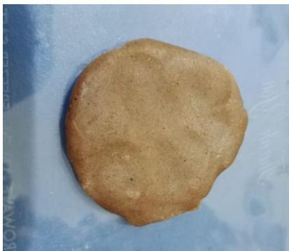
(Penambahan tepung pisang 15%)