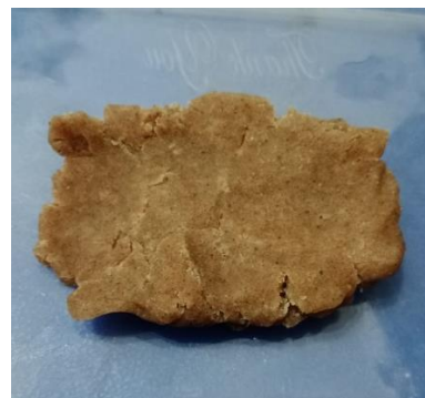
(Penambahan tepung pisang 20%)

Aspek-aspek yang dinilai untuk melihat pengaruh hasil jadi tata rias karakter mak lampir dari bahan tepung pisang dan vaseline :