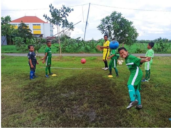
Latihan menggunakan modifikasi bola karet