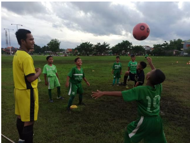
Latihan menggunakan modifikasi bola karet