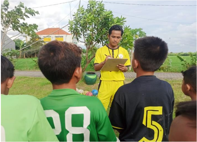
melakukan absensi sebelum pretest