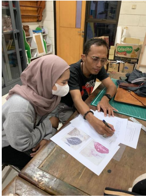
Dokumentasi pasca pengisian kuisisioner