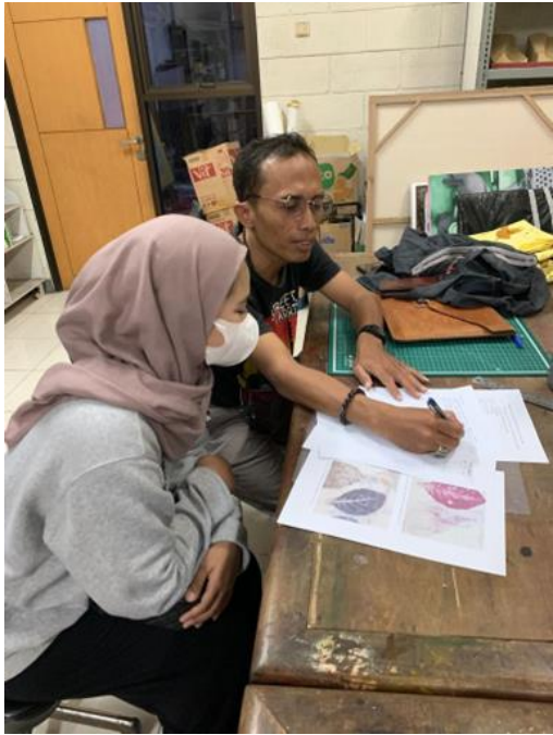
Dokumentasi pada saat validasi kuisisioner