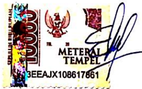
Eka Putri Ambarwati