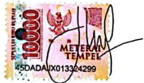
Mody Septia Dilla

Surabaya, 2 Februari 2023 Yang membuat pernyataan,