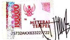
Nurul Izza Awalia Yusuf

Surabaya, 16 Januari 2023 Yang membuat pernyataan,