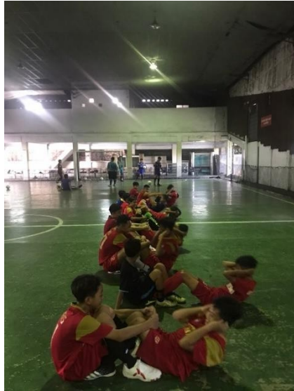
Melaksanakan Sit Up