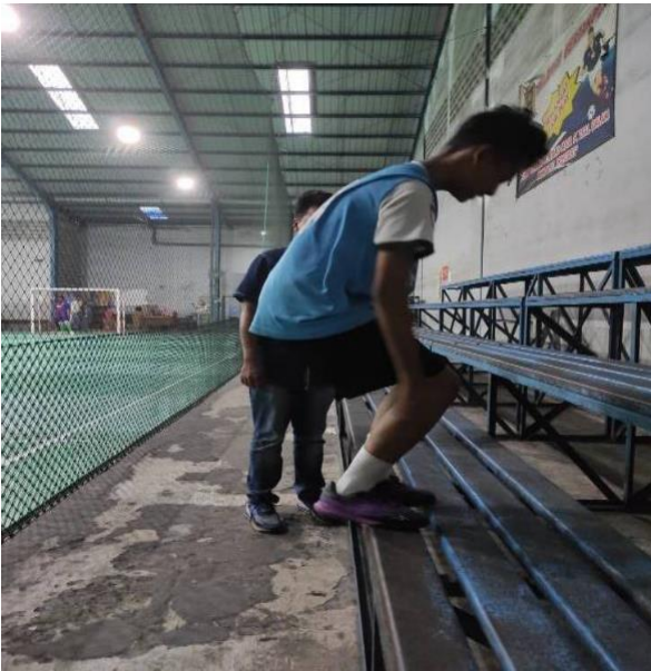
gambar: Jump box