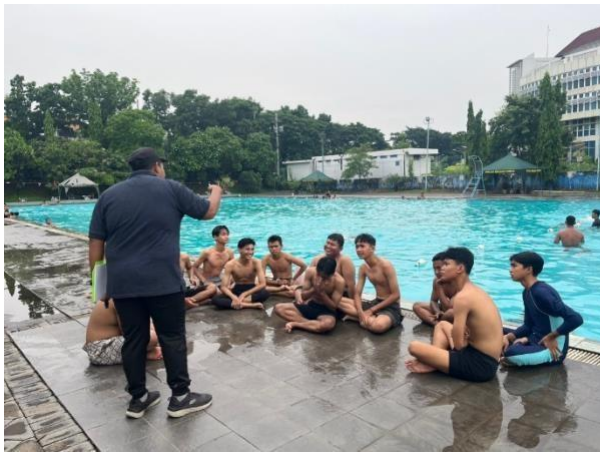
Gambar 1 penyampaian tentang materi renang gaya dada 50 meter.