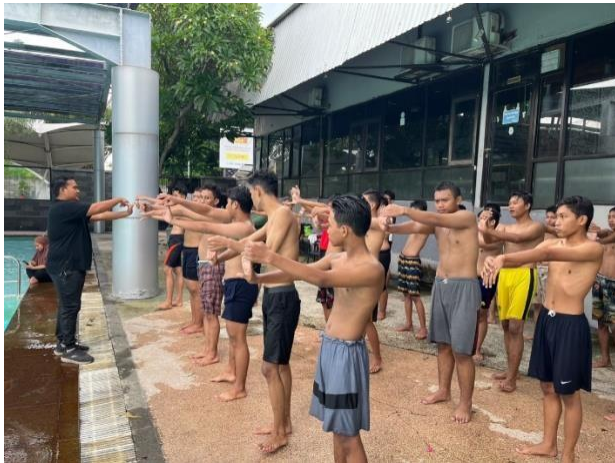
Gambar 3 Pemanasan sebelum melakukan renang.