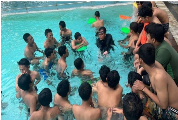
Gambar 4 Pelaksanaan renang gaya dada 50 meter