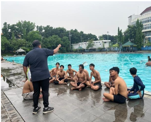
Gambar 2 Penyampaian cara melakukan gerakan yang akan diteliti dan kriteria nilai dalam peneltian renang gaya dada 50 meter.