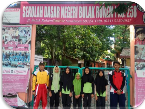
Gambar 8. Sebelum pulang kerumah