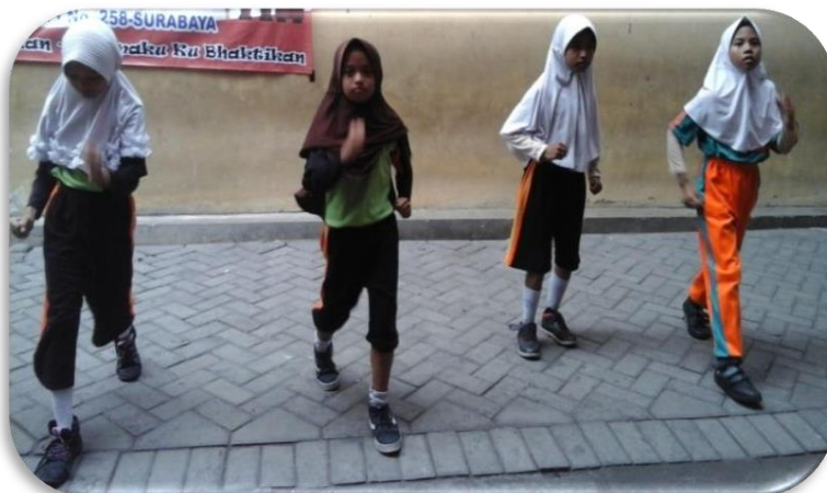
Gambar 2. Perlakuan Latihan SKJ 2012