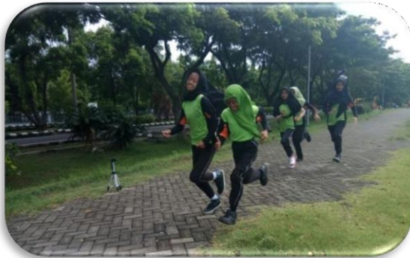
Gambar 7. Test lari 600 meter