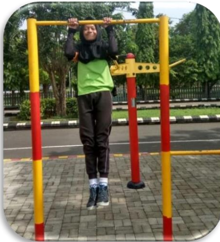
Gambar 4. Test gantung siku tekuk / pull up