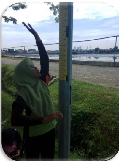
Gamabar 6. Test loncat tegak / vertical jump