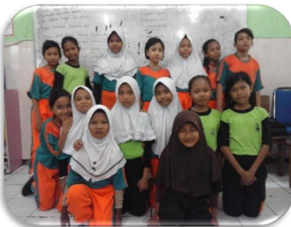
Gambar 1 : Persiapan sebelum test