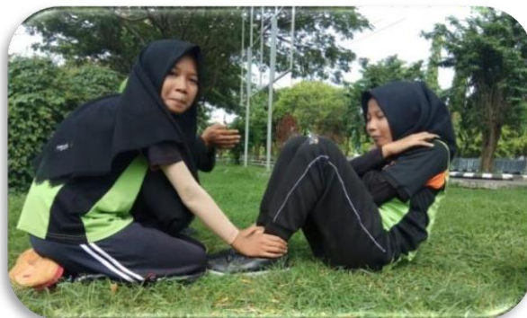
Gambar 5. Test baring duduk / sit up