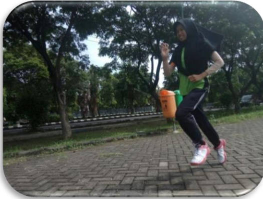
Gambar 3. Test lari 40 meter / sprint