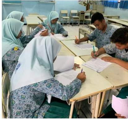
Gambar 4 Post-test