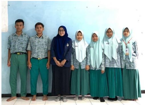
Gambar 5 Siswa siswi yang mendapatkan treatment