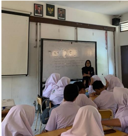
Gambar 2 Pretest