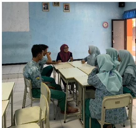
Gambar 3 Memberikan treatment