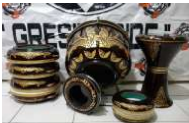
Foto rebana Kabupaten Gresik dengan ornament ikon Kabupaten Gresik