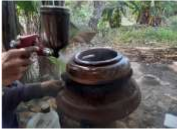
Foto tahap pewarnaan kayu