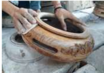
Foto tahap penghalusan kayu