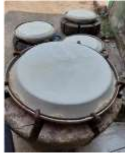
Foto tahap pengepresan kulit