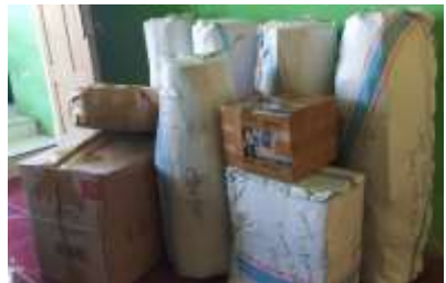
Foto proses pengiriman