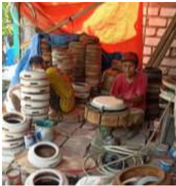
Foto tempat produksi