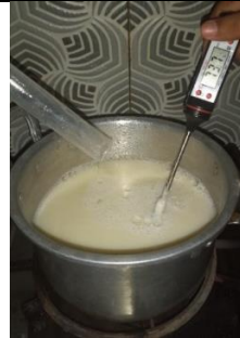
Proses pembuatan pelapis buah emulsi lilin lebah