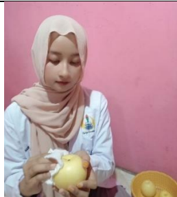
Menyortir/membersihkan buah dari debu atau kotoran