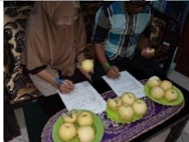
Penilaian organoleptik (warna, tekstur, rasa) oleh panelis