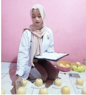
Mendata berat buah awal