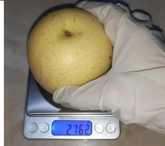
Penimbangan berat buah