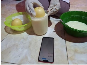
Proses pencelupan buah ke dalam pelapis