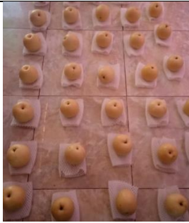
Proses pemilihan buah