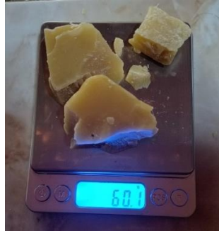
Penimbangan Lilin Lebah