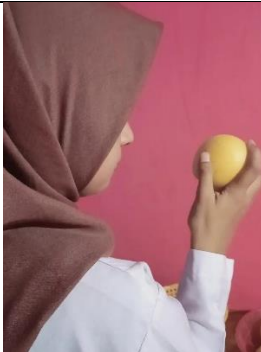
Pengamatan intensitas kerusakan pada buah